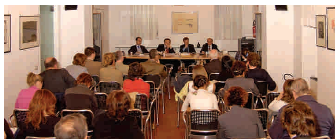
La Sala Convegni

L'Organo di Indirizzo è composto da quindici consiglieri che restano in carica cinque anni: due designati dal Vescovo di Biella; due dal Comune di Biella; due dall'Amministrazione della Provincia di Biella; due dalla Camera di Commercio Industria Artigianato e Agricoltura di Biella; uno, alternativamente, dai Rettori dell'Università e del Politecnico di Torino, scelto tra i professori titolari di insegnamenti presso Città Studi di Biella; sei vengono designati e nominati dall'Organo di Indirizzo.