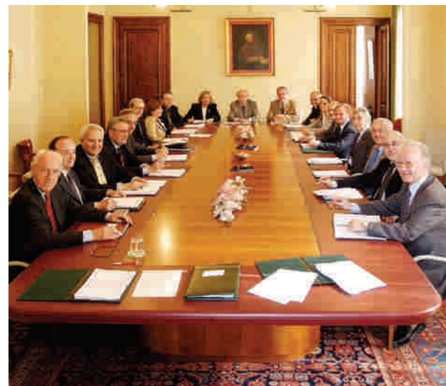
La Sala del Consiglio

All'interno della Fondazione esiste una biblioteca ricca di volumi di interesse locale; nata nel dicembre 2002 grazie alla donazione di circa 2000 volumi da parte di Biverbanca, la biblioteca oggi conta quasi 4.000 volumi, divisi in sezioni tematiche, ed è in continua crescita. Alla biblioteca si affiancano una piccola videoteca e una raccolta di CD. Tutti i materiali sono consultabili dal pubblico. Il catalogo dei volumi è disponibile sul sito della Fondazione, all'interno della sezione archivi.