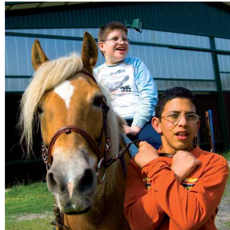
Associazione Sportiva ASAD: Ippoterapia

La salvaguardia e la valorizzazione dell'ambiente naturale rappresenta un importante obiettivo per la Fondazione che da sempre destina fondi a favore di parchi naturali e oasi faunistiche nella consapevolezza che esse rappresentano una ricchezza per il territorio.