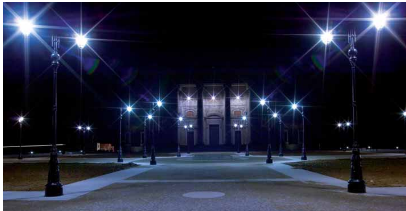
Santuario d'Oropa, il piazzale della Chiesa Nuova