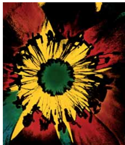
Archivio Martinero: Composizione

L'archivio Martinero, acquisito dalla Fondazione alla fine del 2004 è composto da circa 1700 fotografie e milleduecento diapositive che comprendono immagini diverse: uomini, donne, bambini, paesaggi, composizioni varie (fiori, animali, aeroplani, frutta), paesaggi e composizioni marine, viaggi (Lapponia, Grecia, Jugoslavia, Bulgaria e Africa); completano la raccolta sedici gigantografie montate su pannelli rigidi di soggetti diversi. Le immagini trattate sono state realizzate tra il 1950 e il 1977.