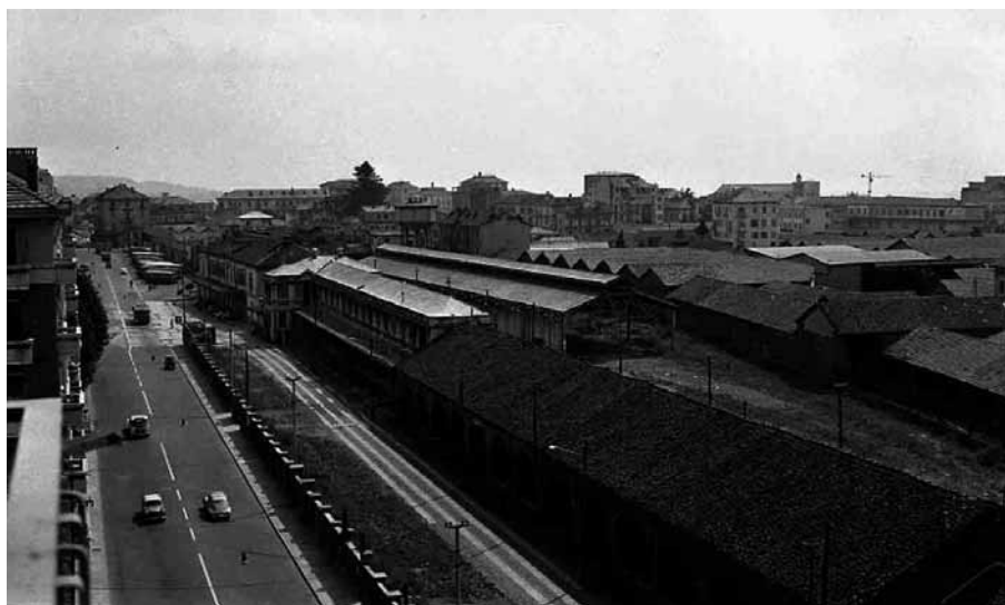
Stazione Biella Santhià

Alcune rubriche originali lo confermerebbero. Quanto acquisito dalla Fondazione (si tratta di parecchie migliaia di negativi) è suddiviso in circa 5700 buste, su ognuna delle quali è sommariamente indicato l'oggetto cui si riferiscono le pellicole. Anche se non del tutto integro, questo fondo è importante perché documenta quasi un ventennio di vita biellese del Novecento. Dell'intero materiale è stato realizzato un inventario iniziale che offre una panoramica della vastità e varietà di soggetti trattati che riguardano spesso cerimonie private ma anche eventi pubblici di rilievo che documentano la vita della comunità biellese.