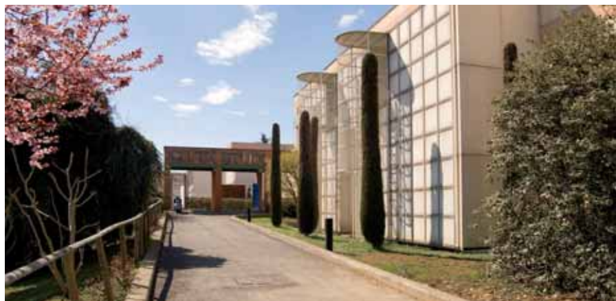
Città Studi, Biella

Alla conclusione dei lavori il complesso di Città Studi, il cui progetto porta la firma di Gae Aulenti, sarà dotato di spazi all'avanguardia, attrezzati per la didattica e la ricerca, nonché di appositi luoghi di studio e di ritrovo. La Fondazione, nel quadriennio preso in esame, ritiene prioritario un ulteriore investimento per far crescere il polo universitario e