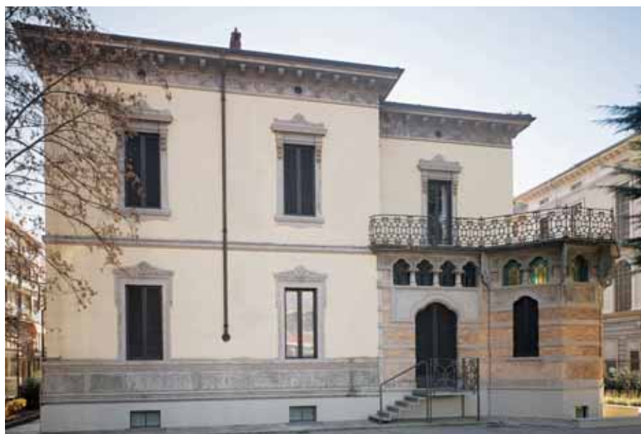
Veduta della Fondazione