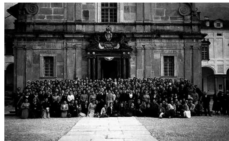
Mondine ad Oropa

interesse per lo studio del territorio e per la pianificazione di interventi per la sua salvaguardia: dall'erosione degli argini dei torrenti alle zone colpite da incendi fino alle aree un tempo coltivate e oggi abbandonate.