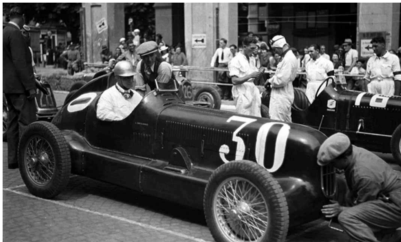
Archivio Valerio: Gara Automobilistica

Per quanto riguarda le modalità di consultazione di detti archivi è allo studio un regolamento che disciplini l'accesso di enti e privati ai fondi. Attualmente è comunque possibile consultare gli archivi della Fondazione, su prenotazione e per motivi di studio e ricerca, effettuando una richiesta formale al Consiglio di Amministrazione e al Presidente dell'ente che valutano ogni singola domanda e le finalità per le quali è formulata.