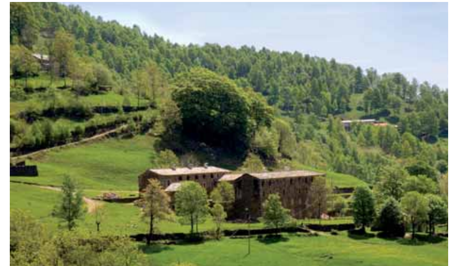
La Trappa - Sordevolo

Altri interventi di rilievo saranno destinati al Museo del Territorio, allestito all'interno del Chiostro di San Sebastiano diventato il cuore culturale della Città di Biella,