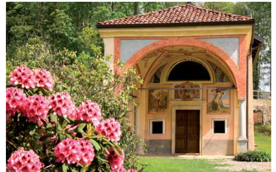
Santuario Madonna della Brughiera - Trivero

della musica e delle arti. Accanto ai contributi destinati a vari Enti e Associazioni per le attività culturali della Città di Biella e di diversi altri comuni sul territorio, la Fondazione si prefigge anche di sostenere progetti capaci di creare reti di relazione tematiche tra comuni e di valorizzare l'intero territorio anche dal punto di vista dell'offerta culturale e turistica. Tra gli interventi più significativi ricordiamo il contributo che annualmente la Fondazione destina al "Premio internazionale Biella per l'Incisione" che rappresenta una delle più rilevanti iniziative artistiche promosse sul territorio e che richiama a Biella artisti provenienti da ogni parte del mondo.