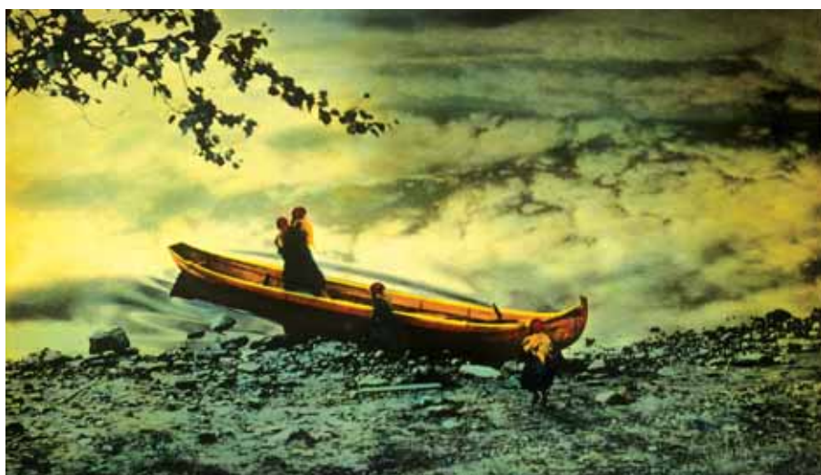
Archivio Martinero: Lapponia

Alcune rubriche originali lo confermerebbero. Quanto acquisito dalla Fondazione (si tratta di parecchie migliaia di negativi) è suddiviso in circa 5700 buste, su ognuna delle quali è sommariamente indicato l'oggetto cui si riferiscono le pellicole. Anche se non del tutto integro, questo fondo è importante perché documenta quasi un ventennio di vita biellese del Novecento. Dell'intero materiale è stato realizzato un inventario iniziale che offre una panoramica della vastità e varietà di soggetti trattati che riguardano spesso cerimonie private ma anche eventi pubblici di rilievo che documentano la vita della comunità biellese.