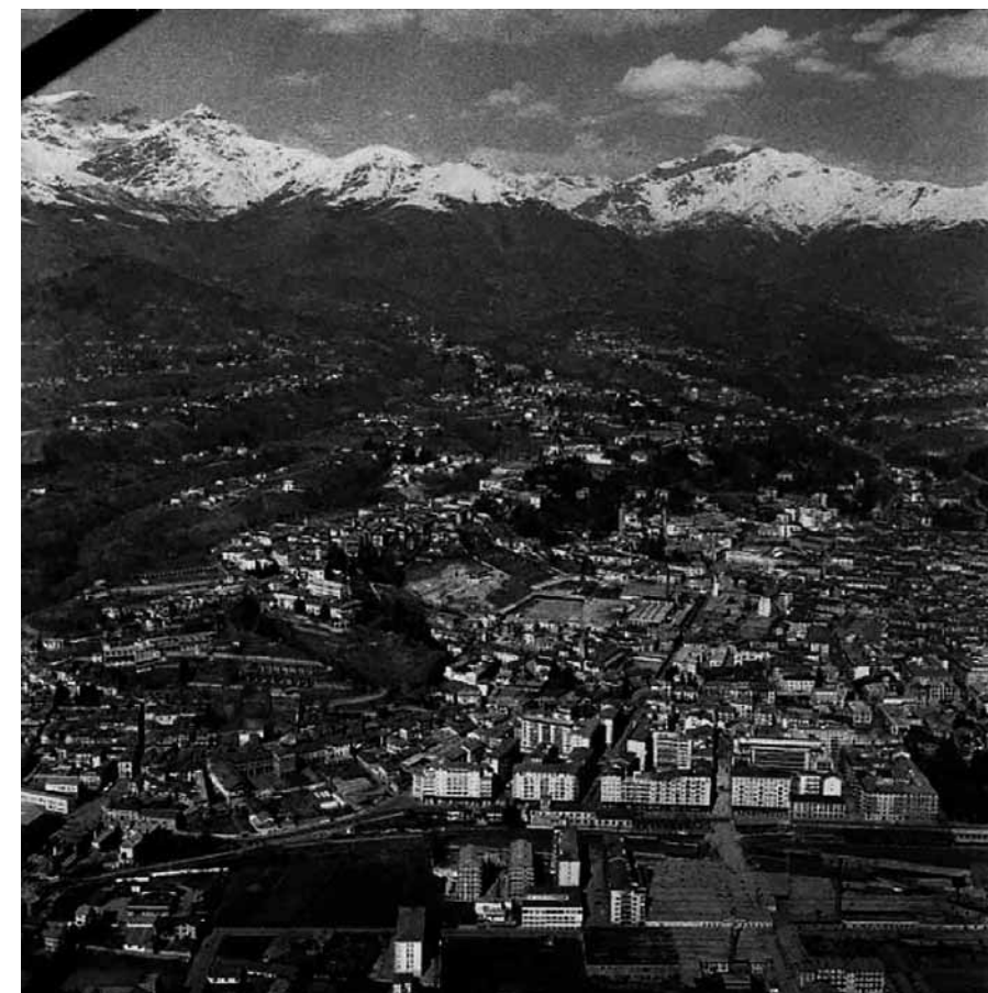
Panorama di Biella con montagne

L'archivio Minoli, oltre a costituire un prezioso strumento di indagine sull'evoluzione urbanistica della città di Biella e degli insediamenti limitrofi, permette infatti di cogliere anche i profondi mutamenti che hanno interessato il territorio in seguito ad eventi atmosferici particolarmente