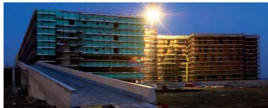
Il cantiere del nuovo Ospedale di Biella

L'intera operazione ha un costo complessivo di oltre 12,8 milioni di euro a cui la Fondazione contribuisce con un'erogazione di circa 2,6 milioni di euro (pari al 20% della spesa totale) di cui Euro 1.028.000,00 già stanziati. Beneficiari delle erogazioni sono sia gli enti locali sia, direttamente, i singoli centri. Si tratta dunque di un vasto progetto pluriennale che si affianca ai tradizionali interventi nel campo dell'assistenza agli anziani che continueranno ad essere deliberati sulla base delle richieste che perverranno. Fra gli interventi più ricorrenti ricordiamo la fornitura di servizi socio-assistenziali per la terza età e il supporto economico per il rinnovo delle attrezzature e la messa a norma delle strutture.