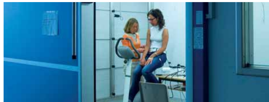
Il laboratorio di Tessile e Salute

La produzione intellettuale rappresenta un valore aggiunto insostituibile per la crescita economica e culturale di ogni Paese. L'Italia purtroppo vanta un primato negativo fra i paesi dell'Unione Europea in quanto, oltre a destinare quote molto basse del proprio PIL alla ricerca, mette in atto tortuosi meccanismi accademici a causa dei quali i giovani ricercatori, formati a spese del sistema-paese, sono fortemente incentivati a portare all'estero le proprie conoscenze, regalando a paesi più organizzati e più ricchi di fondi gli anni migliori della propria produzione e i risultati delle proprie ricerche, risultati che, soprattutto in campo scientifico, l'Italia "reimporta" poi a caro prezzo. Senza avere la pretesa di risolvere problemi le cui radici affondano nella stessa struttura del sistema accademico italiano, il contributo della Fondazione nel settore della ricerca dovrà essere concentrato nel sostenere l'attività di Città Studi e Tessile e Salute e sul finanziamento di borse di studio e altre iniziative volte a promuovere l'accesso dei giovani alla ricerca.