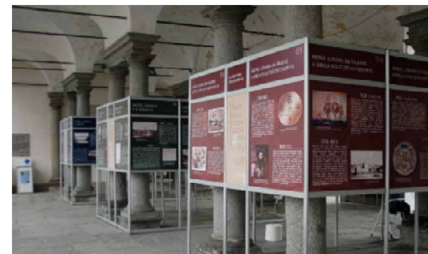
Allestimento della mostra