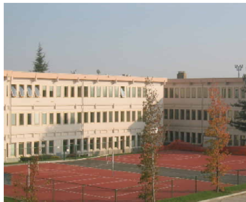
Campi sportivi a Città Studi, Biella

Sono state investite risorse per complessivi € 70.000 per la realizzazione del progetto LIS dedicato all'integrazione dei bambini non udenti attraverso l'apprendimento della lingua italiana dei segni. Per favorire lo sviluppo di un sano spirito sportivo 27.000 euro sono stati impegnati per promuovere l'attivazione di progetti di avvicinamento allo sport (giocosport e altri) all'interno delle scuole. Oltre a questi vanno ricordati i contributi vari dedicati all'acquisto di attrezzature informatiche, a ristrutturazioni e alla realizzazione di progetti diversi.