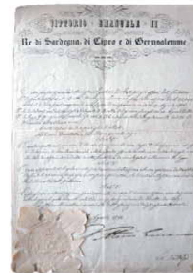
Il Regio Decreto di approvazione del regolamento della Cassa di Risparmio di Biella e Circondario del 24 agosto 1856

Oropa. Losana è sepolto lassù, ma non è solo il riposo eterno a legare monsignore alla Vergine Bruna, sono altresì il costante contatto con la quotidianità di Oropa, l'interesse per le istanze devozionali e, soprattutto, l'averla salvata dalla soppressione nel 1868, grazie anche a quel suo buon amico che fu Quintino Sella. Il secondo riguarda invece il vincolo forte tra l'opera di mons. Losana e la Fondazione Cassa di Risparmio di Biella. Attraverso le vicende della Cassa di Risparmio e più ancora dopo la separazione dell'ambito creditizio (che è la Biverbanca), la "filosofia" di impegno benefico dedicato al territorio, alla cultura, all'assistenza, al Biellese come valore d'insieme di Giovanni Pietro Losana si è mantenuta intatta, dal fondatore alla Fondazione.