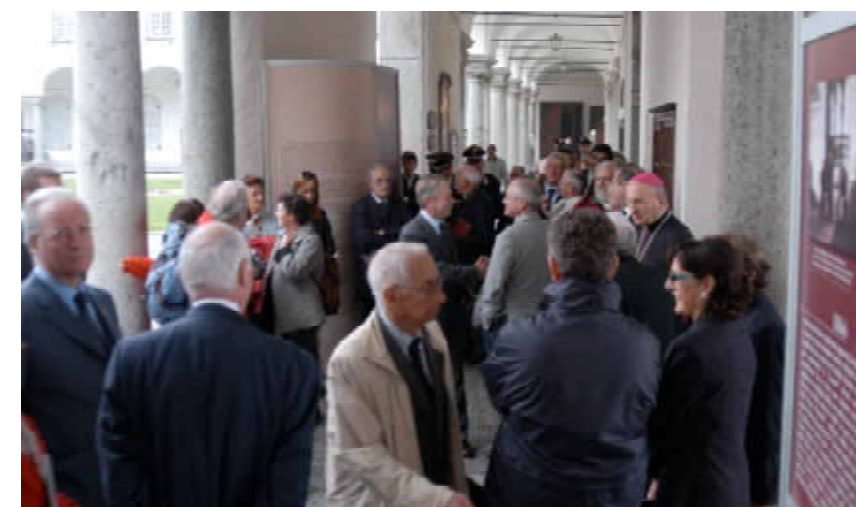
Inaugurazione della mostra