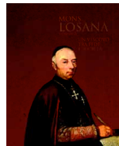
Frontespizio del catalogo della mostra

La mostra, riallestita a Biella, presso i portici del Duomo, sarà visitabile sino gennaio 2007.