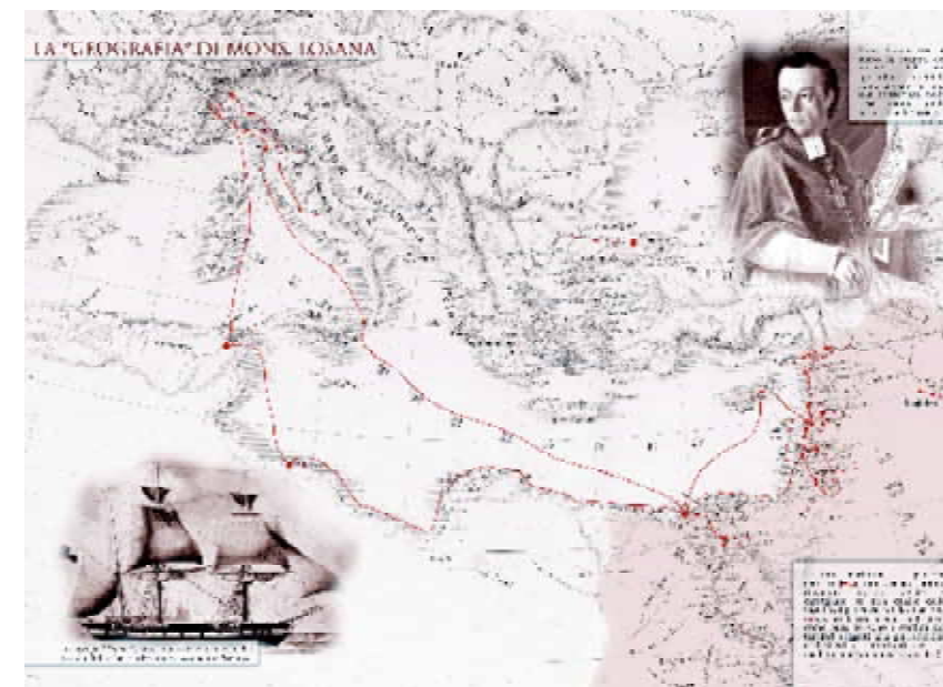
La mappa dei viaggi di mons. Losana