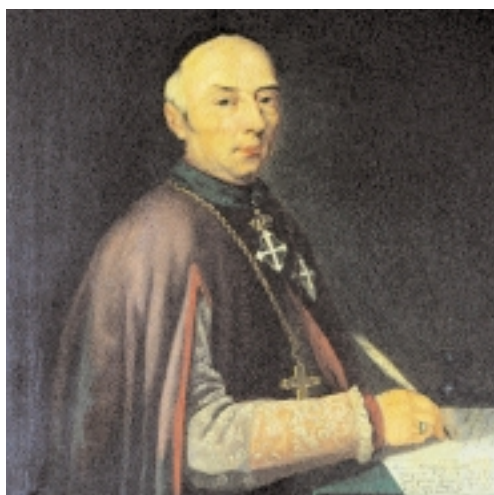
Ritratto di Mons. Giovanni Pietro Losana, Vescovo di Biella, Fondatore della Cassa di Risparmio di Biella