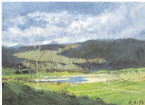
Lorenzo Delleani, Luci e ombre sulla Serra, 1899 Giuseppe Bozzalla, Nel bosco di Castagnea, 1902

In conclusione la Fondazione, anche nel 2002, ha mantenuto il proprio ruolo di punto di riferimento per il territorio, destinando risorse a numerose iniziative, espressione della vitalità delle associazioni operanti nel Biellese e salvaguardando al contempo un patrimonio frutto del lavoro di generazioni di risparmiatori.