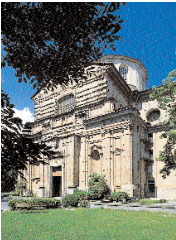
Facciata del Santuario di Graglia