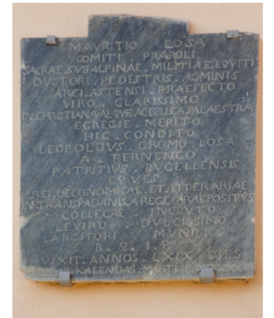
Palazzo Gromo Losa. Lapide in onore del conte Maurizio Losa di Prarolo.

due proprietà il figlio di una delle due sorelle, Leopoldo Gromo di Ternengo. Quando Maurizio morì, il nipote Leopoldo si premurò di far comporre una lapide commemorativa in onore dello zio, lapide che è tuttora collocata nel giardino del Palazzo, su una delle pareti del fabbricato occidentale.