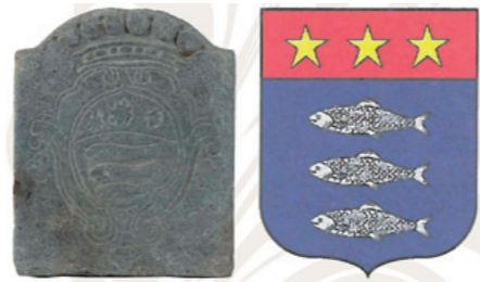
Stemma lapideo dei Losa (Collezione Fondazione Cassa di Risparmio di Biella) e sua versione a colori.

Durante i lavori di restauro nelle cantine del Palazzo è stata rinvenuta una lastra in pietra con scolpita in bassorilievo l'arma dei Losa (d'azzurro a tre pesci - cheppie - d'argento, uno sull'altro; col capo di rosso, cucito, carico di tre stelle d'oro, ordinate in fascia), in uno scudo di forma ovale cartocciato, sormontato da corona a sette perle e accollato alla croce mauriziana.