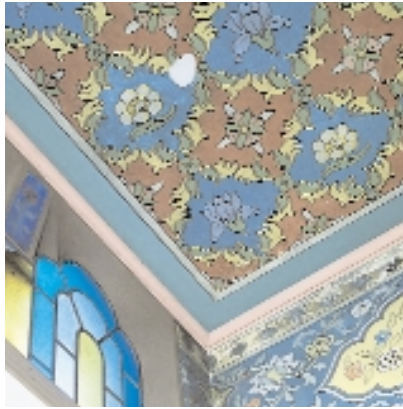
Particolari dei soffitti della sede di via Garibaldi

assistenza e beneficenza (7,02 %), ricerca scientifica (circa 1 %).