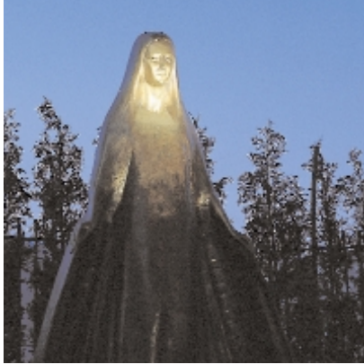
La "Madonna del Piumin" dello scultore Sandrún, all'interno del cortile della sede e Saletta d'attesa