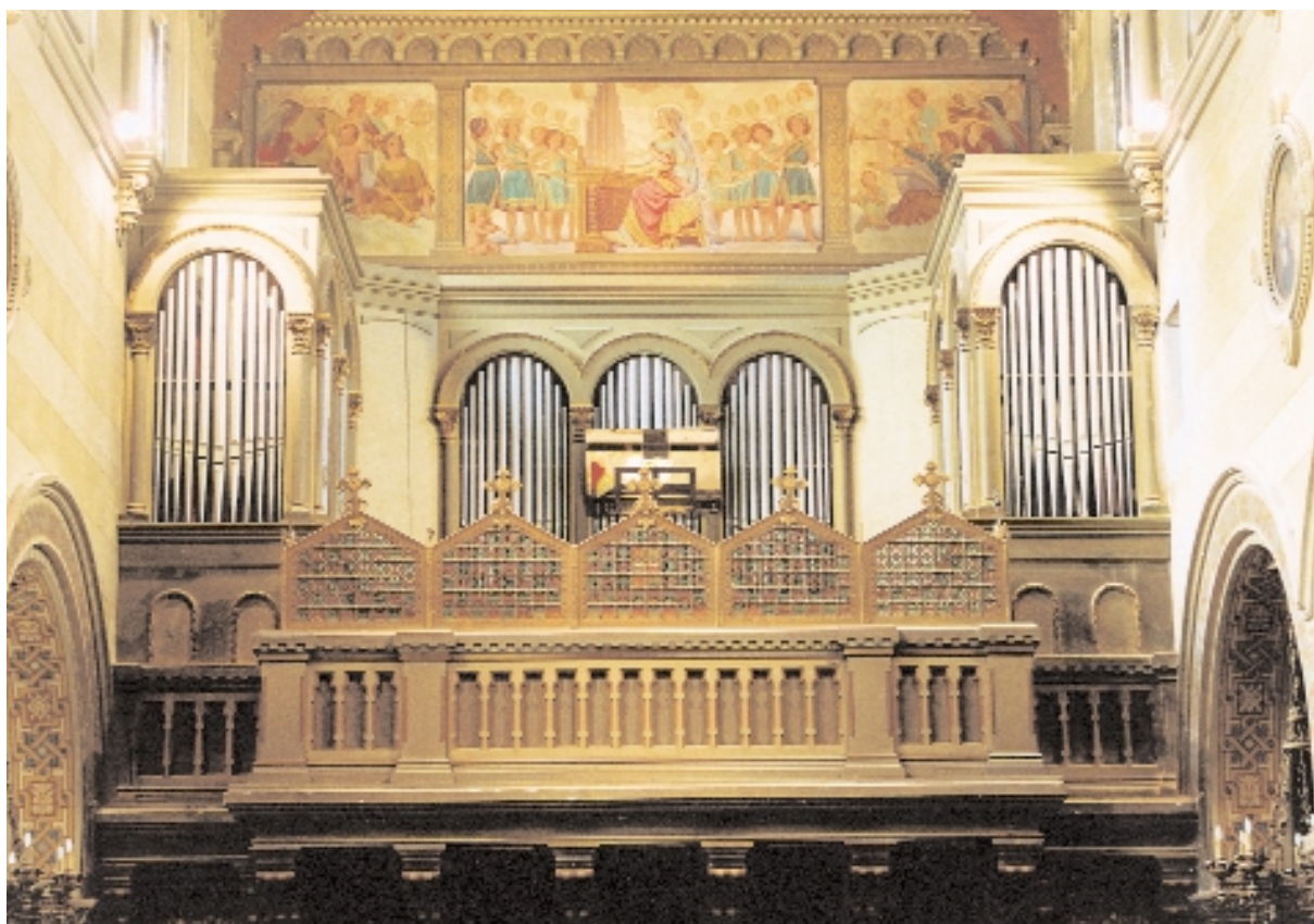
Organo della chiesa di San Giuseppe Operaio, Vigliano Biellese